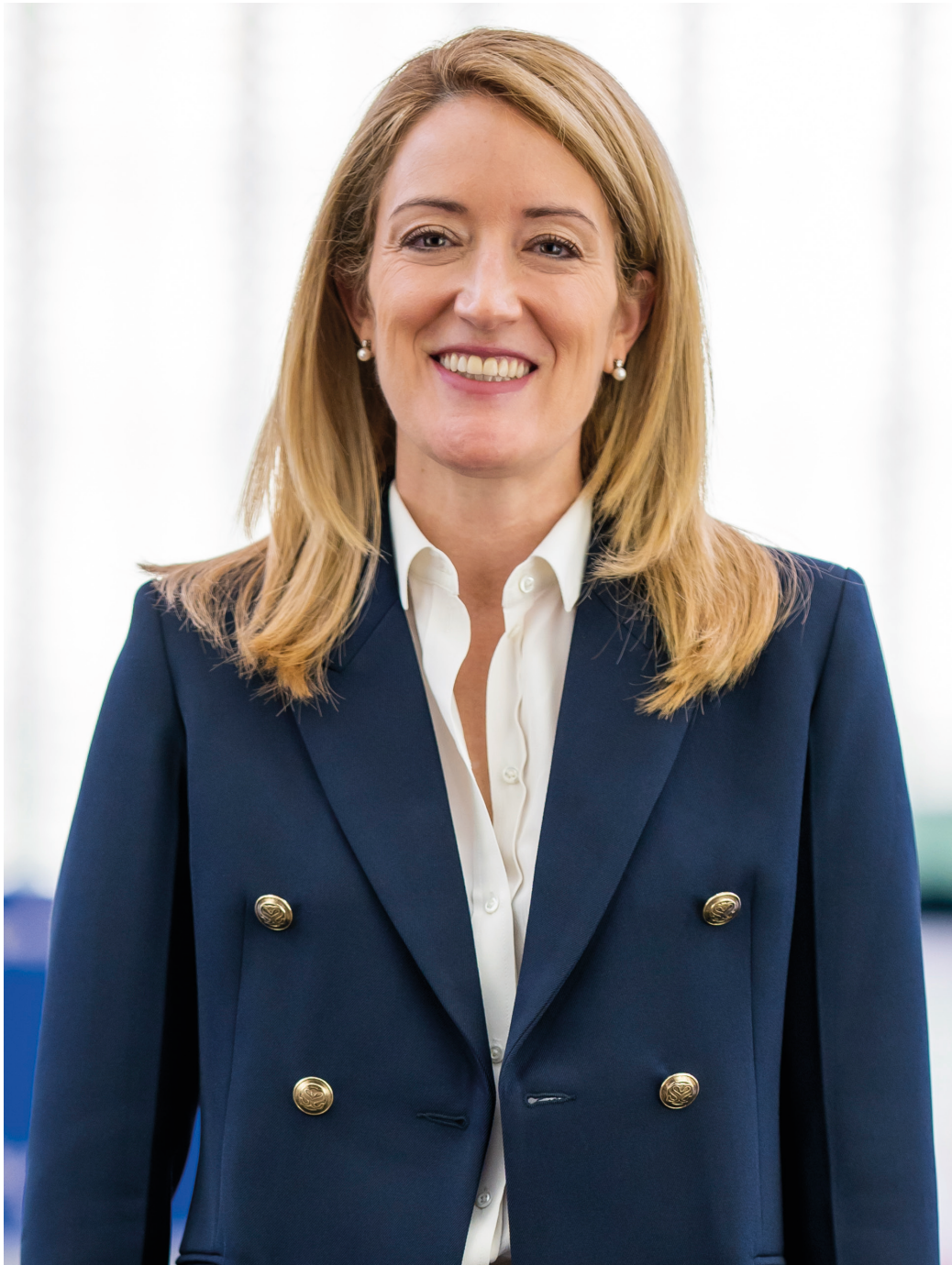
Roberta Metsola Présidente du Parlement européen.